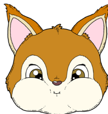
NABIERANIE POWIETRZA W OBA POLICZKI.