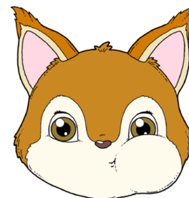
NABIERANIE POWIETRZA NAPRZEMIENNIE – RAZ W PRAWY, RAZ W LEWY POLICZEK.