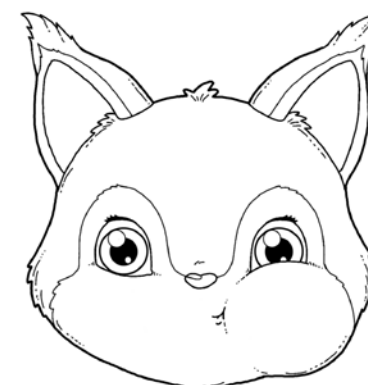
NABIERANIE POWIETRZA NAPRZEMIENNIE – RAZ W PRAWY, RAZ W LEWY POLICZEK.