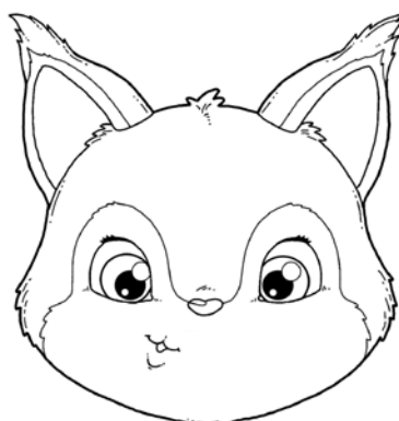
ROBIENIE „DZIÓBKA” I PRZESUWANIE GO RAZ W PRAWO, RAZ W LEWO.