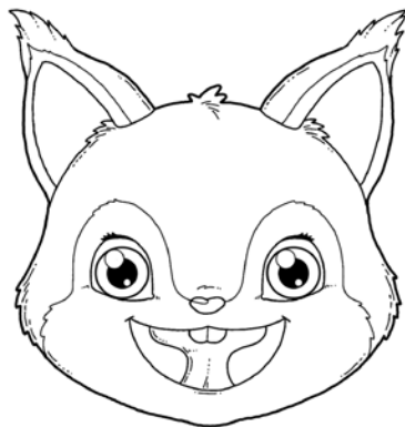
„WINDA” – PRZYKLEJANIE CAŁEJ POWIERZCHNI JĘZYKA DO PODNIEBIENIA.