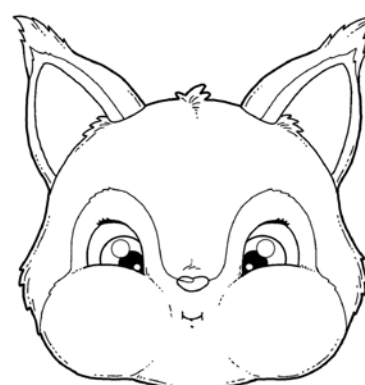
NABIERANIE POWIETRZA W OBA POLICZKI.