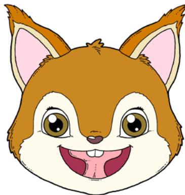
„WINDA” – PRZYKLEJANIE CAŁEJ POWIERZCHNI JĘZYKA DO PODNIEBIENIA.