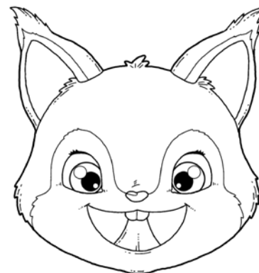
„MALOWANIE SUFITU” – PRZESUWANIE CZUBKIEM JĘZYKA PO PODNIEBIENIU (OD GÓRNYCH ZĘBÓW W GŁĄB JAMY USTNEJ).