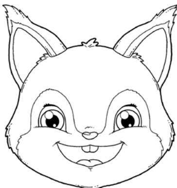
SZEROKI UŚMIECH I „DZIÓBEK” – NAPRZEMIENNIE.