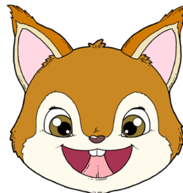
„MALOWANIE SUFITU” – PRZESUWANIE CZUBKIEM JĘZYKA PO PODNIEBIENIU (OD GÓRNYCH ZĘBÓW W GŁĘB JAMY USTNEJ).