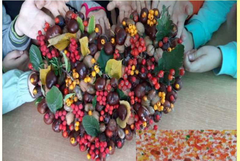
Uczniowie z kl. II b

Dla klimatologów ważna jest jesień meteorologiczna i ta rozpoczęła się 1 września. Obejmuje ona zawsze trzy pełne miesiące: wrzesień, październik i listopad.