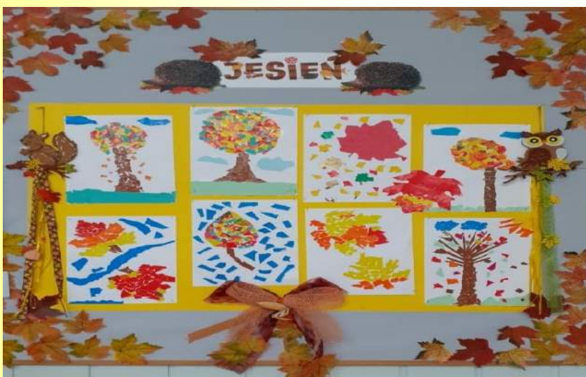
Uczniowie z kl. I b

Naszą świetlicę ozdobiły jesienne prace wykonane podczas zajęć plastycznych.