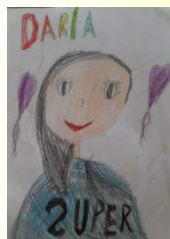
Ala B. Kl. I b